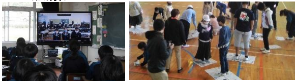
3年：オンライン交流