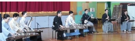
全学年：文化芸術体験（和楽器）