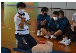
2年保健：救急救命法