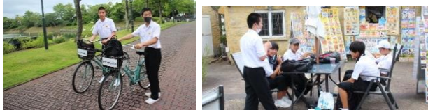
全力で遊んだ後のバスではやっぱり… (=_=)